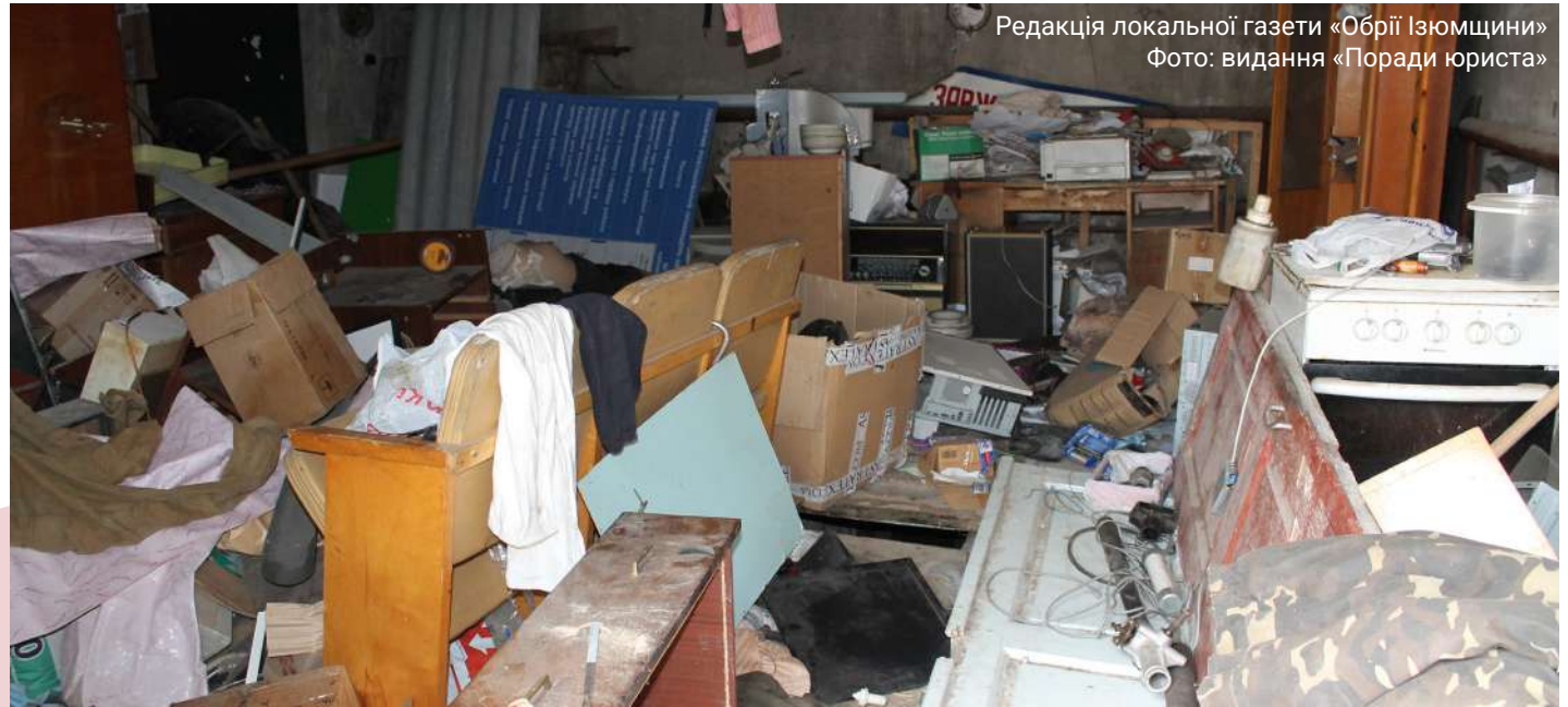
Редакція локальної газети «Обрії Ізюмщини»

Жертвами російської агресії в Україні стали не лише медійники, які нині працюють у журналістиці. Національна спілка журналістів України висловлює захоплення громадянським подвигом тих працівників ЗМІ, які, залишивши до часу журналістську професію, захищають Україну в лавах Сил оборони. На жаль, станом на кінець 2022 року 24 з них загинули.