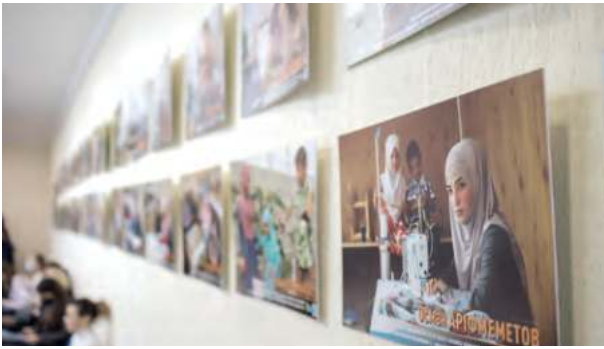
Фотовиставка НСЖУ «Громадянські журналісти важливі!»