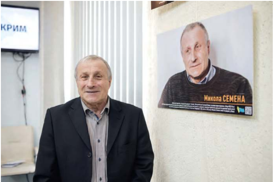
Фотовиставка НСЖУ «Громадянські журналісти важливі!»

- пам'ятні дати або роковини трагічних подій: 26 лютого – День кримського спротиву російській окупації, 18 травня – День пам'яті жертв геноциду кримськотатарського народу, - інші події в Криму й навколо нього.