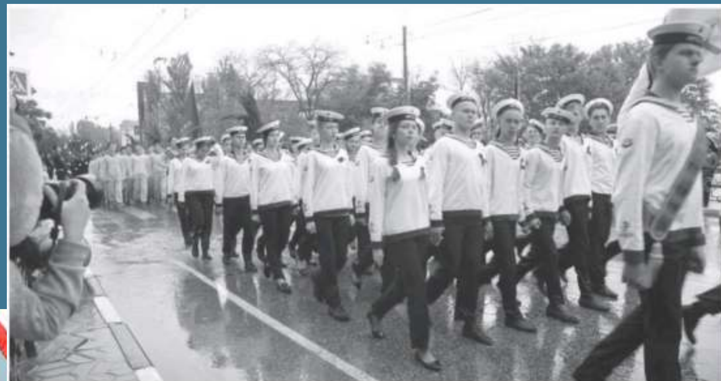
Військовий парад у Керчі 9 травня 2019 року за участі молоді та підлітків